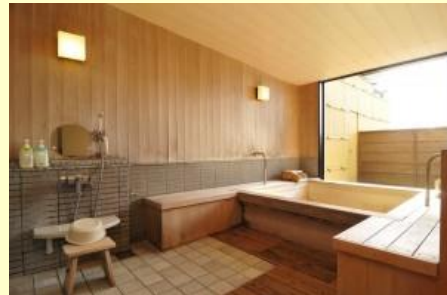
バリアフリー・さいわいの湯

入浴・休憩 500円 (税別) 午前 11 時 00 分～午後 3 時 00 分