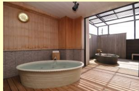
信楽焼風呂・ときめきの湯