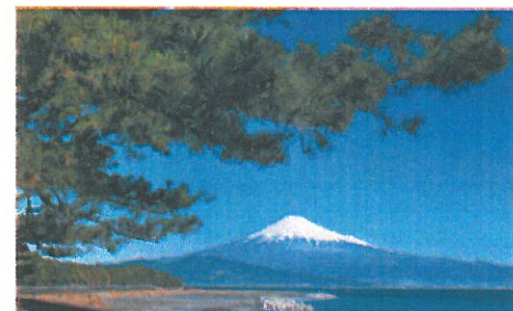
④の鎌ヶ崎から望む